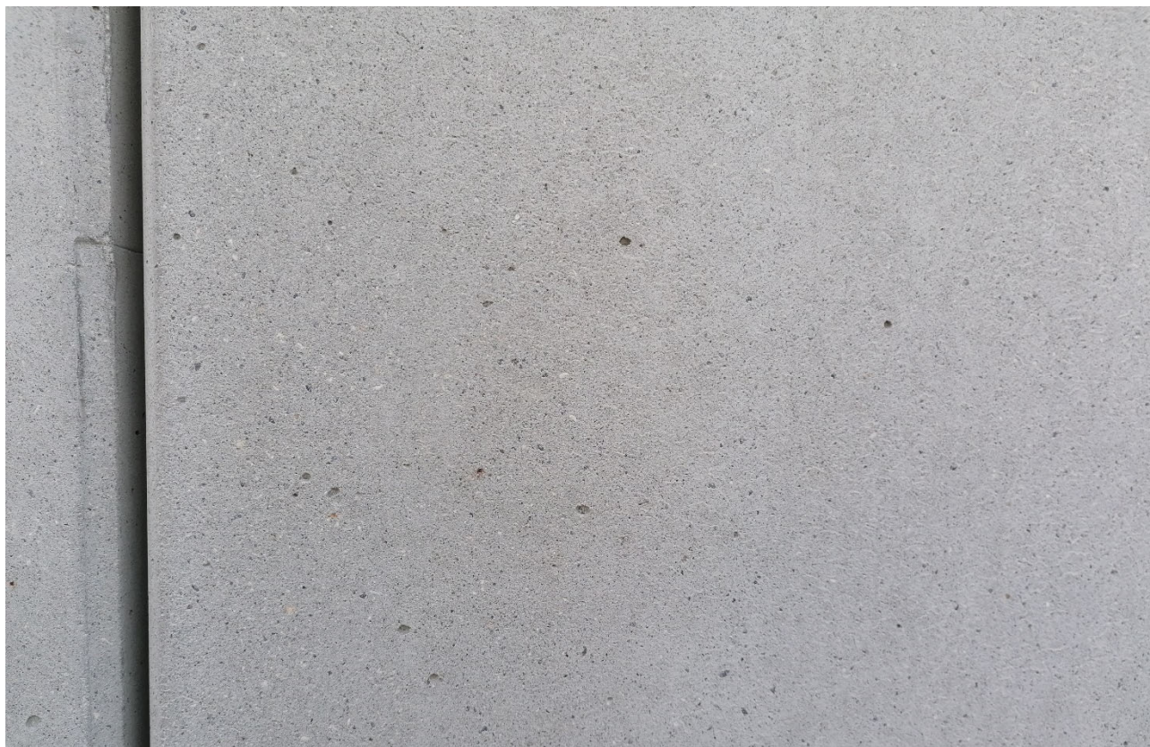
Povrch betonu hladký, celistvý, vyrovnaný, ve stejném barevném odstínu, bez nutnosti dodatečného stěrkování či omítání!