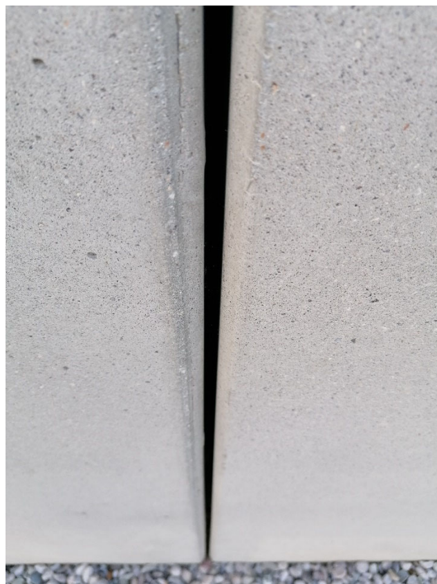
Konstantní šířky svislých spár, zkosení hran bez otřepů.